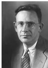
LEONARD BLOOMFIELD – prekursor deskrytywizmu