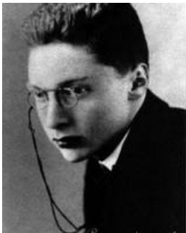
ROMAN JAKOBSON: problem UNIWERSALIÓW JĘZYKOWYCH