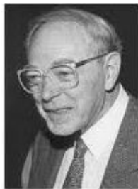
Zellig S. Harris ZELIG HARRIS